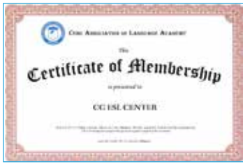
セブ語学院協会会員