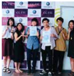
From. Banilad Noah

CGに来てから約4ヶ月が経ちました。時間の流れは遅いようでとても早かったです。初めてのCGに来た時、私は英語で挨拶をすることしか出来なく、この先のCG LIFEに不安を感じていました。僕が、不安を感じ生活している一週目、僕の不安を解消させてくれた出来事がありました。英語が喋れない僕にも関わらず、韓国人の友達が僕を旅行に誘ってくれました。もちろん、そこでは英語しか通じないわけであってとても大変でしたが、彼らが僕に英語がわからなくてもとにかく頑張って話せば、相手に言いたいことが伝わると言うことを教えてくれました。そこで、僕の不安はなくなりとにかく積極的に英語を話せるようになりました。僕の英語が間違っていればみんな正しい文に直して教えてくれたりと、とても親切な人ばかりでの皆様には感謝しきれません。僕がCGに来て英語に対して感じたことは、とにかく、とにかく人と会話して会話することが一番の英語の上達方法だと感じました。人それぞれ自分の中でよく使う英単語があると思います。僕が思うには同じ場所に住み生徒は僕の兄弟でオフィスは僕の親のようでした。他の学校と比べ、みんなの距離が近かったと思います。それはCGのルールが厳しいからこそだと思います。