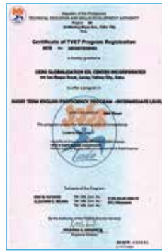
フィリピン教育部TESDA