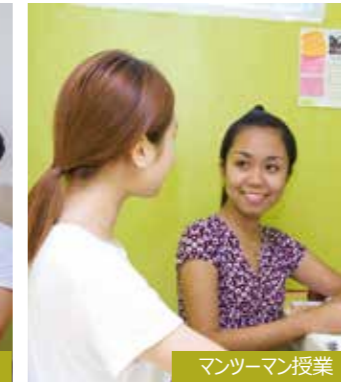
マンツーマン授業