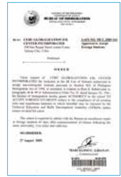
フィリピン移民局SSP