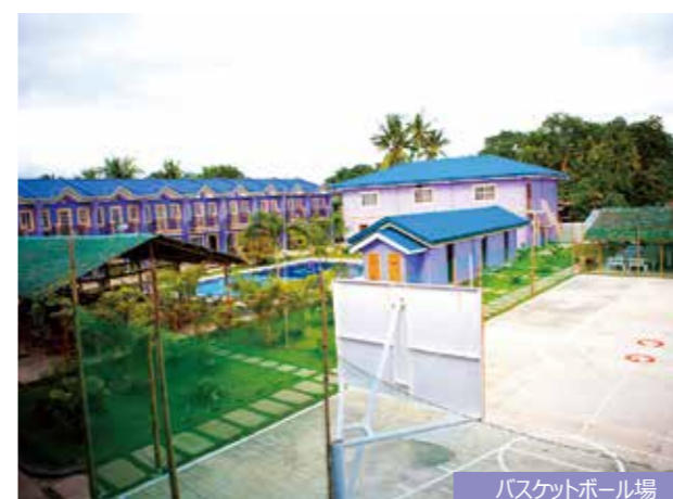
バスケットボール場