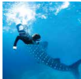
From. Banilad Nemo

If you want to study English in an environment where there are not many Japanese, I recommend CG. These past 12 weeks were precious experiences for me.