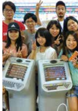
From. Sparta Sky

I had a nice time in CG for 1month. CG has strict rule that pushes me to study. For example, EOP(English only policy), and I can't go out during week days. I think that I can't have the chance to put myself in this strict environment again. You may think "Isn't it too strict?," There are humorous teachers, a lot of friends from other countries, cheering each other, and having some time to play made me not to think that it's hard to endure. I can study English practically, different from the one that I can learn in Japan. So, I could get TOEIC score surprisingly higher than before. Thanks to everyone in CG. If you're hesitating, I recommend you to study in CG!