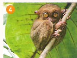
ボホール島 世界最小のサル「ターシャ」に会う。