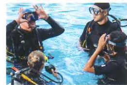
短期留学カリキュラム表(例)

放課後は是非サークル活動を。いろいろな団体がありますよ。さまざまな国の学生と友情を深めましょう。