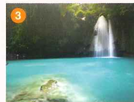
カワサン滝 透明度が抜群で青色を保つ滝壺。