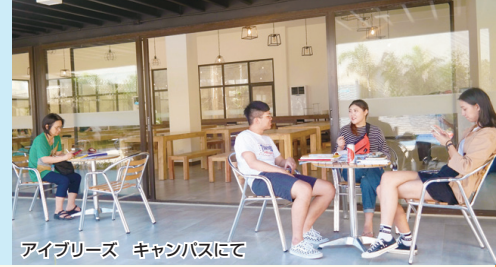
アイブリーズ キャンパスにて