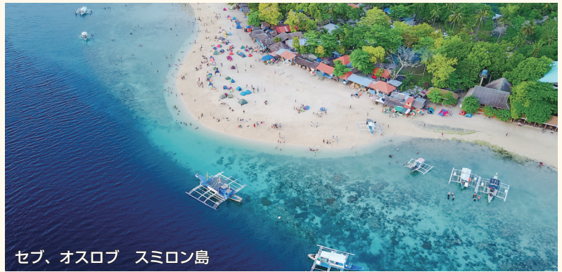
セブ、オスロブ スミロン島