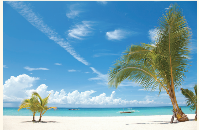
フィリピン、パンタヤン島ビーチイメージ

避暑地として知られるバギオは標高1500mと高く、山岳地方の中心の都市で月の平均が20度を下回るくらいです（セブより10度ほど下回ります）。涼しく過ごしやすいため、以前は大統領府などマニラの政府機関が年に数ヶ月、バギオに移転することもありました。クラークの語学学校では、アメリカ人の講師が多いこともあり、アメリカ英語でのクラスが多くなっています。東京からマニラやセブまで直行便だと4時間半ほどです。時差は日本が1時間進んでいます。