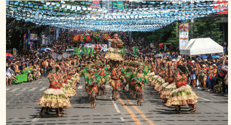
例年1月、500年以上続くとされるセブのシヌログ・フェスティバル